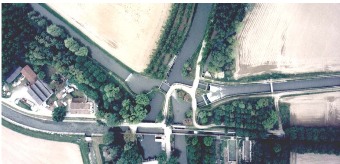
Vista aerea del 'nodo idraulico' di Tombe Morte

Altrettanto famoso è il sito dei 'Tredici Ponti' lungo la strada statale che da Casalmorano va a Genivolta. Passata la trattoria 'La Speranza', lasciata sulla destra procedendo verso Genivolta, la strada oltrepassa ben tredici ponti nello spazio di duecento metri. Sono altrettanti canali che, lasciata Tombe Morte , non si sono ancora separati, ma corrono paralleli.